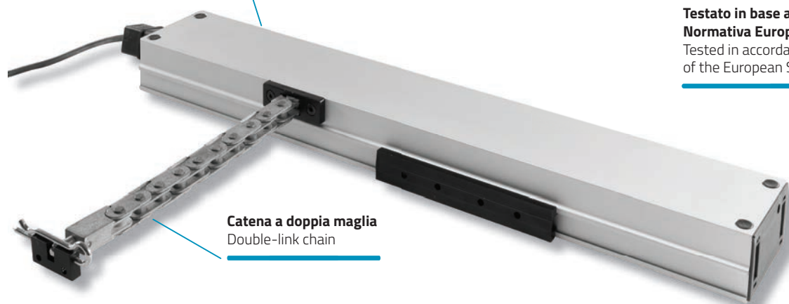
Catena a doppia maglia Double-link chain

Testato in base alle specifiche della Normativa Europea EN 12101 - 2 Tested in accordance with the requirements of the European Standard EN 12101 - 2